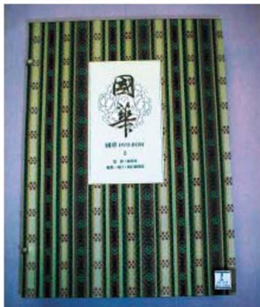
『國華』DVD-ROM 1-2 創刊号(1889年)~1274号(2001年) <本館所蔵>

れている。「美術ハ国民ノ美術ナリ国華ハ国民ヲシテ自国ノ美術ヲ守護スルノ必要ヲ唱導シテ止マサラントス」との文面からもその使命感と啓蒙的姿勢は明らかである。また、そのためには「歴史畫」というジャンルが重要であることも強調されている。つづいて九鬼隆一「国華の発兌ニ就テ」フェノロサ「浮世繪史考」ピゲロー「日本工藝家の注意」岡倉覚三「円山応挙」といった論考を掲載している。「國華」には「歴史教科書」にも必ず登場する美術に関わる人物の名がきら星のごとく並んでいる。ウイーン万博(明治六年)に発するジャポニスムの影響下、西洋のまなざしが浮世絵や工芸品に注目し、「日本美術」のイメージを作り出す一方で、「日本」が主体となって多くの貴重な古美術品の流出を防ぎ、世界に認められる「日本」の「美術」を守り、「美術史」を形成しなければならぬという事情が『國華』の創刊を促したといえよう。